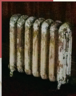
Un radiateur de l'église avant remise à neuf et électrification