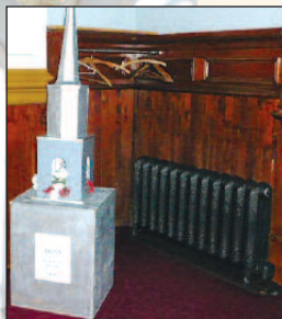
Radiateur redimensionné, remis à neuf et électrifié