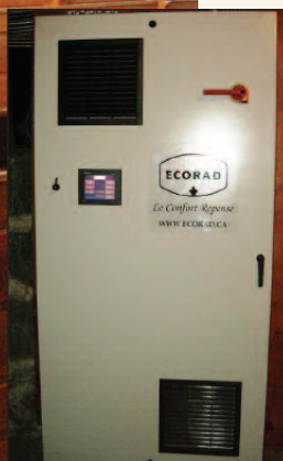
Panneau de contrôle SSR automatisé

Leader de la conversion à l'électricité des anciens radiateurs à eau chaude et à vapeur depuis 2007, Ecorad a développé un dispositif électrique qui peut être intégré dans chaque radiateur pour qu'ainsi, chacun puisse être contrôlé indépendamment ou par zone, à la guise du consommateur via un thermostat électronique ou un panneau de contrôle immotique. Un procédé écologique, efficace et économique qui permet aux institutions et aux résidences de faire des économies très importantes tout en conservant le charme et le confort procurés par ces chefs-d'œuvre de nos ancêtres, sans le casse tête de la tuyauterie et de l'entretien de celle-ci.