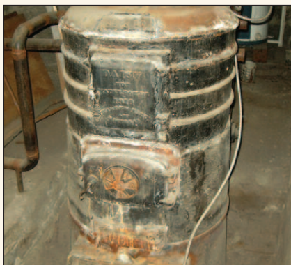
2 e fournaise désuète qui fut éliminée

du bâtiment et de la température extérieure afin de limiter la puissance appelée à 75 kW et obtenir le tarif d'Hydro-Québec le plus bas possible malgré une charge totale de 130 kW.